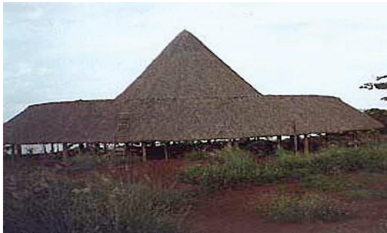
Edificação de madeira com cobertura de fibras vegetais